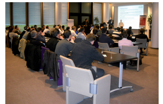
Workshop n°1 : 1 er avril 2011 chez Schneider Electric (Rueil Malmaison)