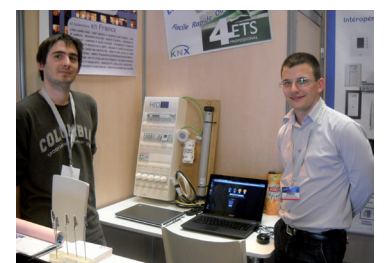
KNX a bénéficié d'une forte mobilisation de l'Université de Rennes lors du salon Rexel de Rennes